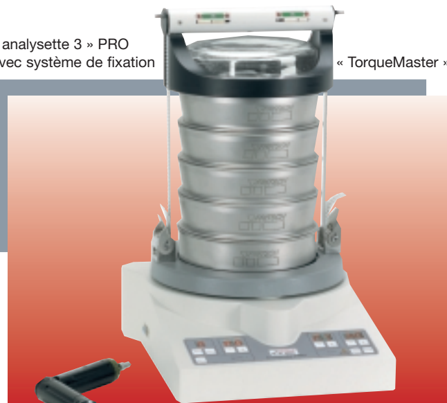
« TorqueMaster »