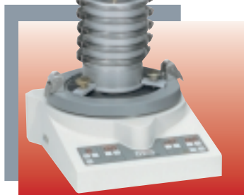
« analysette 3 » PRO pour tamisage de micro-précision