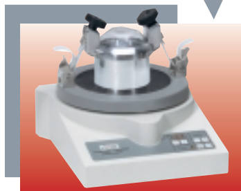
Microbroyeur à vibrations « pulverisette 0 »